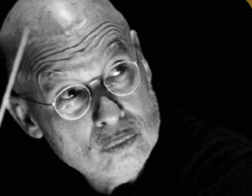
Dennis Russell Davies