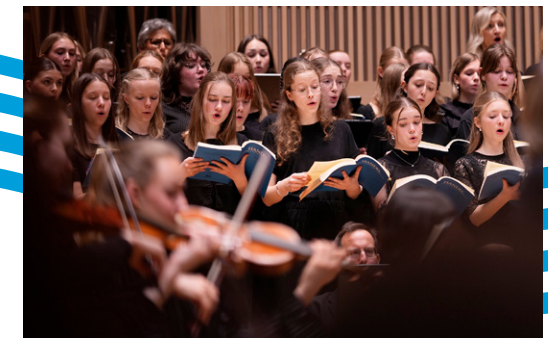
Chor des Musikgymnasiums Linz