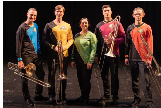
Mission Planet B

Mit freundlicher Unterstützung der LINZ AG