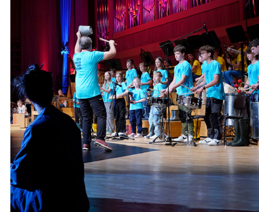
Ein Haus voll Musik 2025