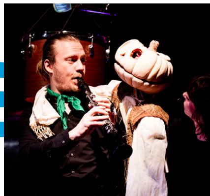
Der Zauberer von Oz