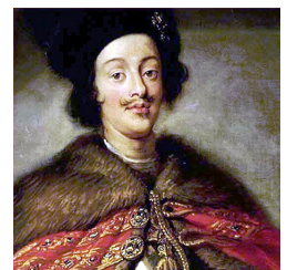
Johann Jacob Froberger

Johann Jacob Froberger wurde am 9. April 1616 in Stuttgart (Deutschland) geboren. Er wirkte in Wien mit Unterbrechungen mehrere Jahre als Hoforganist und auch im Bereich der Kammermusik. Froberger starb im Jahr 1667 auf Schloss Héricourt in Frankreich. Er ist der bedeutendste Komponist für Tasteninstrumente des süd-deutsch-österreichischen Raums im 17. Jahrhundert.