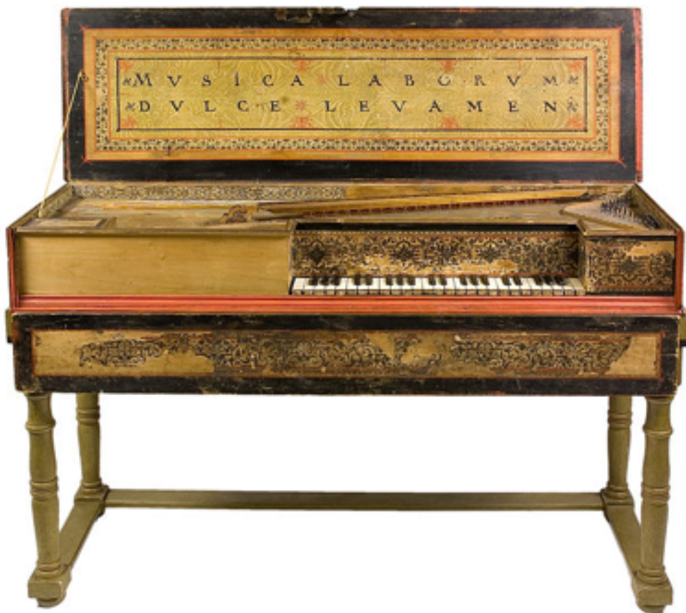
Virginal kleine Bauform des Cembalos, auch Spinett genannt

Das Virginal ist eine kleine Bauform des Cembalos. Die Saiten verlaufen parallel zur Klaviatur, somit quer zu den Tasten und werden von Kielen (auch: Plektren) über eine von der Klaviatur betätigte Mechanik gezupft. Virginale sind meist einmanualig sowie einchörig. Ihre Form ist meist rechteckig, jedoch kommen vor allem in Italien auch Virginale in polygonaler Form, das heißt mit mehreren Seiten (fünf bis sieben), vor. Solch ein Originalinstrument aus der Zeit um 1600, das in Norditalien gebaut wurde, wird Alexander Gergelyfi im Konzert spielen. Diese kleinen Tasten- und auch Kielinstrumente haben entweder fest montierte Beine (Tischform) oder sehen aus wie eine Kiste/Box, das heißt sie haben keine montierten Beine. Das Repertoire für Virginal besteht im Grunde aus jeglicher Musik für Tasteninstrumente, die vor 1650 komponiert wurde, wie z. B. einfache Tänze oder Ricercari. Zahlreiche Darstellungen in der Bildenden Kunst und auch Zeugnisse aus der Literatur machen deutlich, dass dieses Instrument häufig auch von Frauen gespielt wurde.