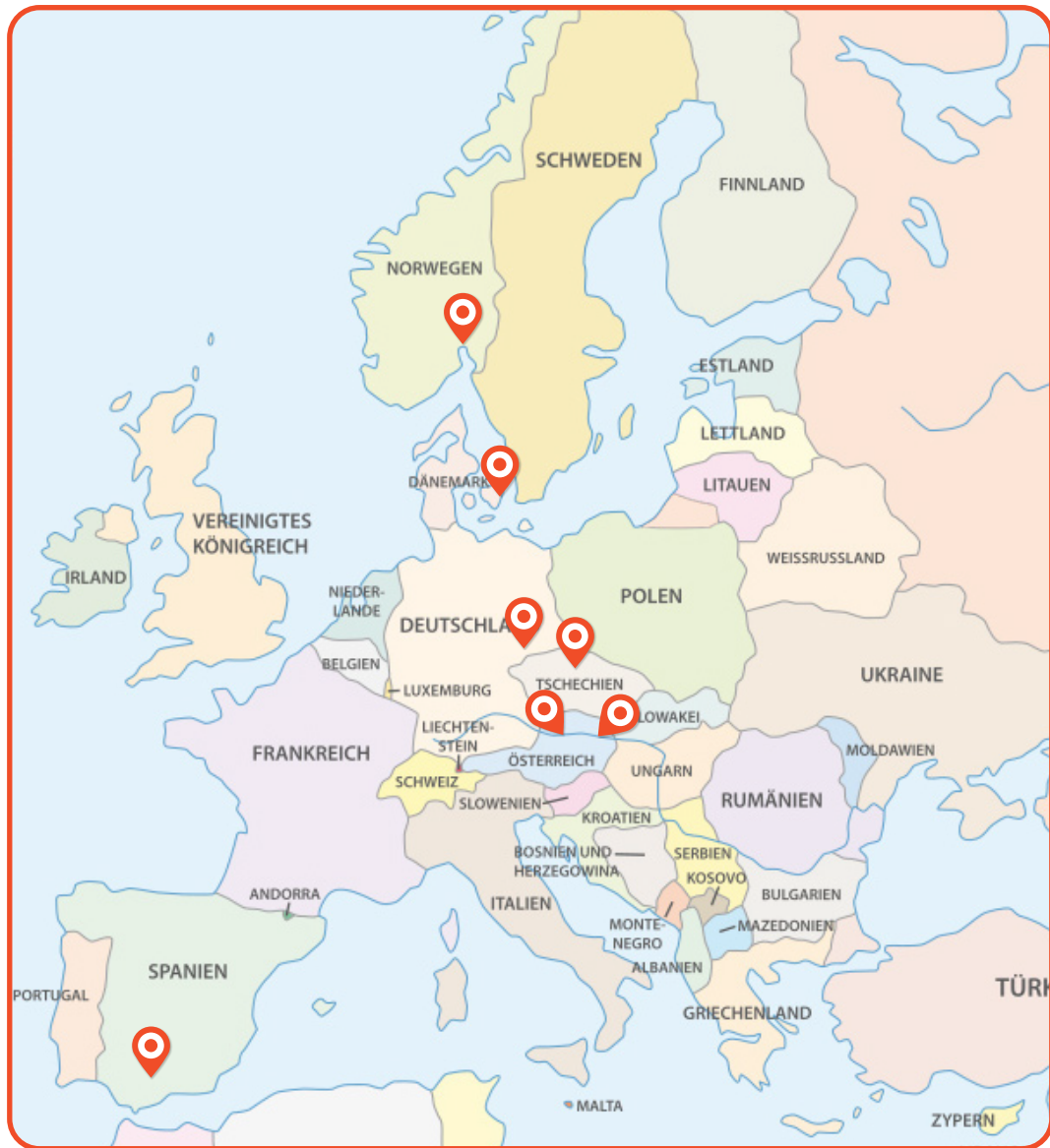
Linz (Österreich), Prag (Tschechien), Oslo (Norwegen), Dresden (Deutschland), Sevilla (Spanien), Kopenhagen (Dänemark), Wien (Österreich)